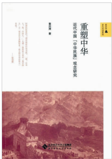
《重塑中华:近代中国“中华民族”观念研究》,黄兴涛著,北京师范大学出版社,2017年10月第一版

“中华民族”这一概念就像一个多棱镜,它多面向地折射出近代中国民族认同的思想、文化、政治等方面的丰富内涵。作者运用历时性与