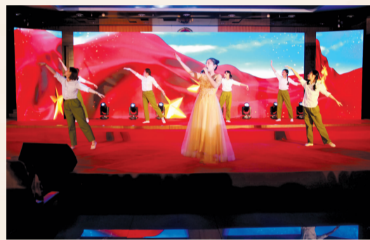
上城区法院以歌舞庆祝新中国成立70周年