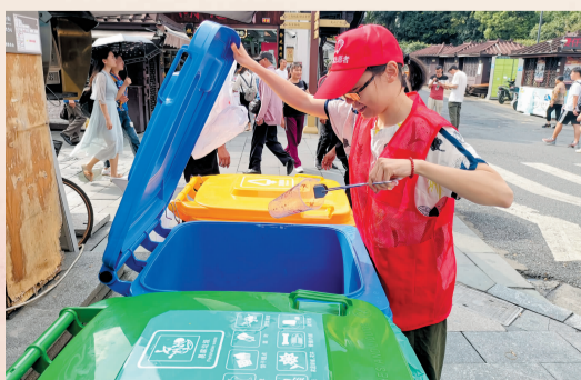
清波街道党员干部和团员青年走上街头开展垃圾分类志愿服务