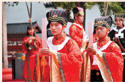
开展祭孔大典,传承中华优秀传统文化