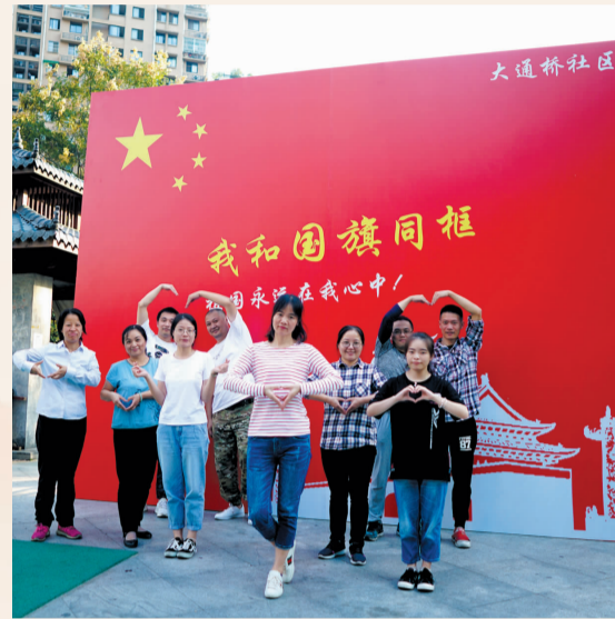
望江街道群众在“我和国旗同框”背景前拍照留影