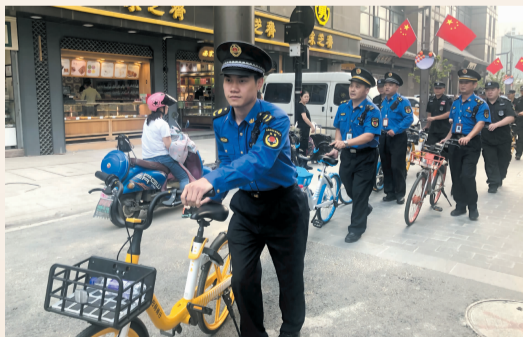
城管执法队员进一步加强路面巡查力度,为市民游客出游提供良好的市容环境