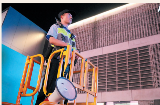
人流密集区,上城执勤民警以最挺拔的身姿,站成一道风景线

当大家沉浸在与家同乐、与国同庆的欢声笑语中时,也有这样一群人的国庆节,叫做放假“不打烊”。他们坚守在岗、为民服务,披星戴月、从心出发,用辛勤汗水向祖国深情告白,以秩序井然为祖国献上一份“特殊的礼物”。