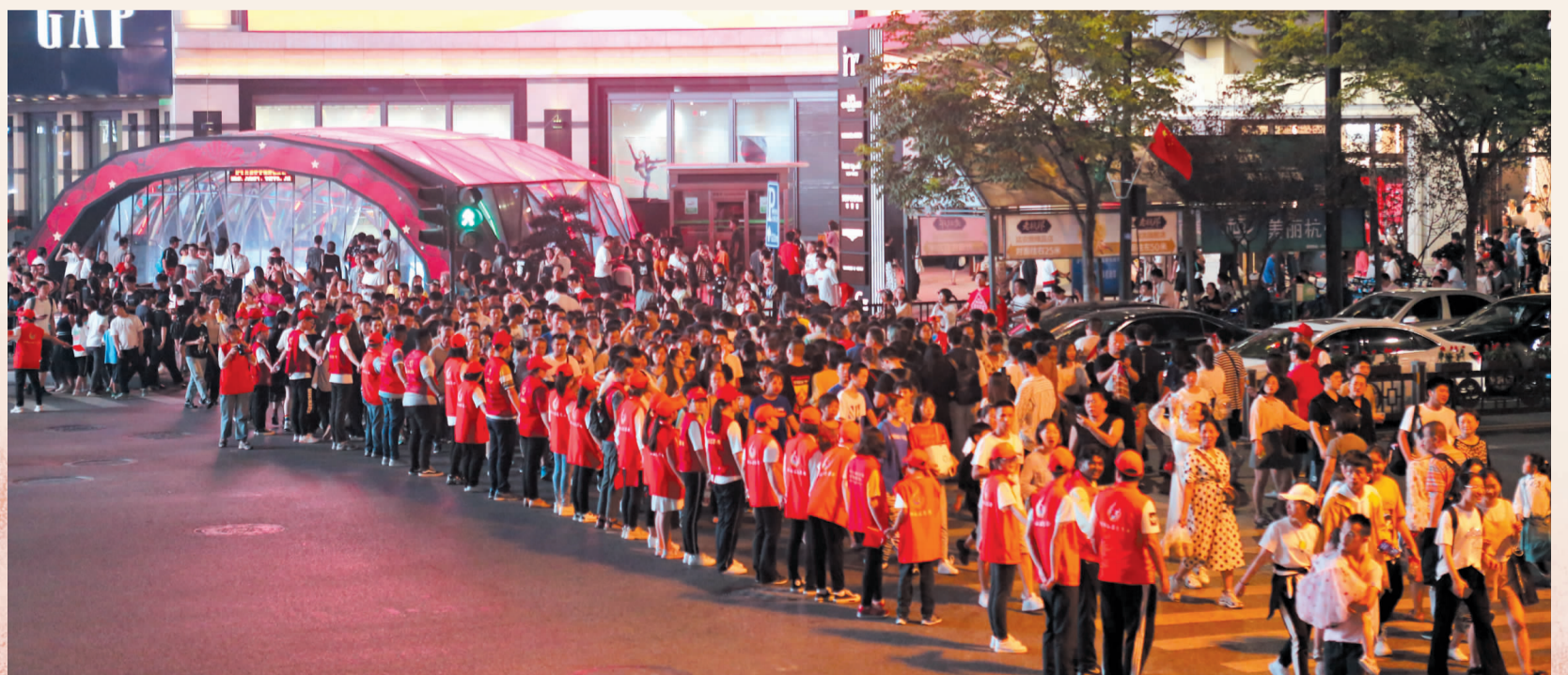
人潮涌动中,上城志愿者筑起一道“红色屏障”,引导过街行人安全有序通行