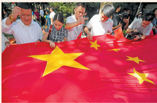
在小营公园,来自上城各界的统战代表人士共同绣国旗