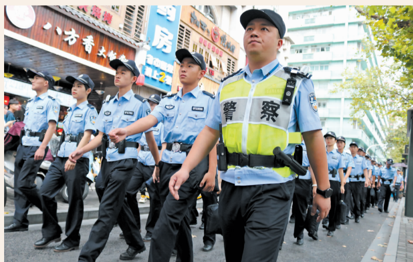
上城区公安分局全警奋战,全力维护辖区秩序