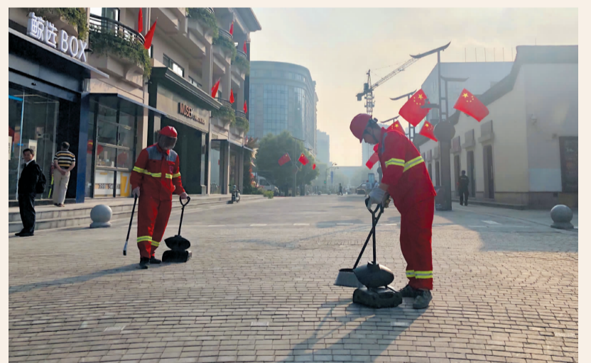
骄阳下,环卫工人全天候保障道路整洁,用行动唱响最美旋律