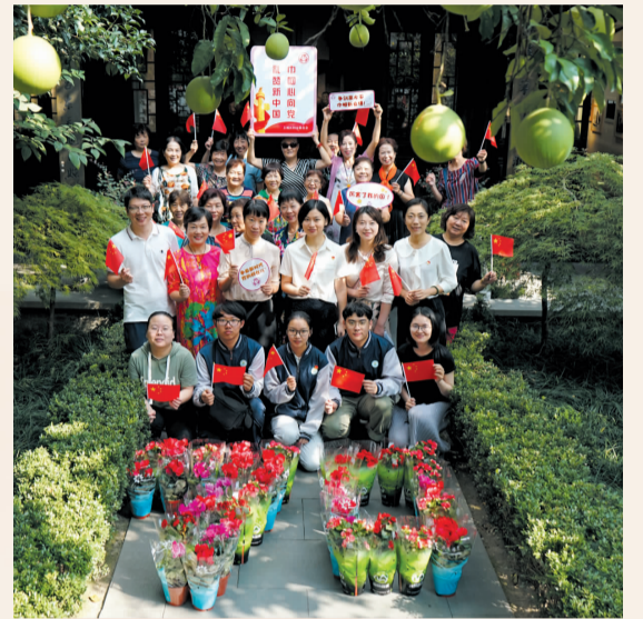
妇女和家庭扮靓家园,为祖国母亲送上深情祝福