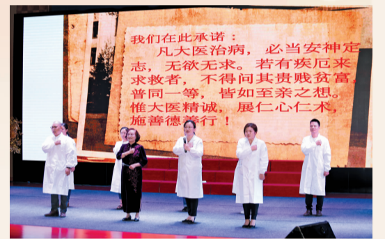
社区医务工作者庄严宣誓,诠释新时代的使命和担当