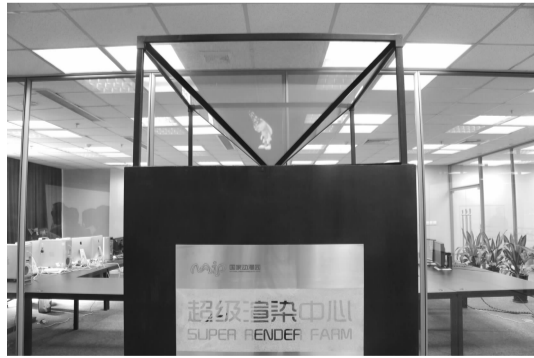
▲超级渲染中心为天津国家动漫产业综合示范园动漫产业提供强大的技术支持。