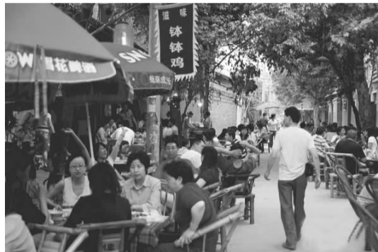
▲走走宽窄巷、喝喝大碗茶、摆摆龙门阵,已成为成都市民的一种生活习惯。