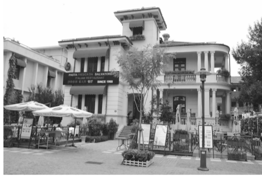
▲天津新·意街的意大利餐厅、咖啡店彰显浓郁的地中海风情。