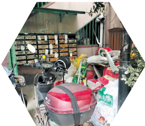
大王庙巷10号3单元门口堆放装修垃圾