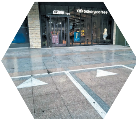
定安路西湖银泰门口人行道板破损