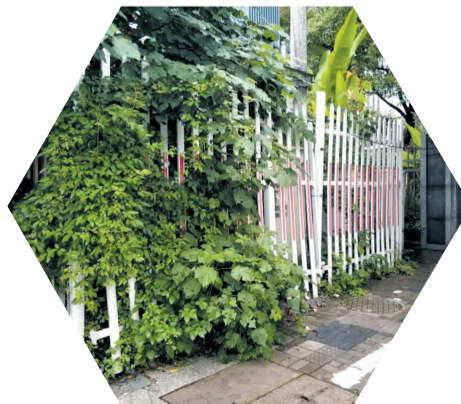
望江东路与鲲鹏路交叉口西北侧变压器护栏破损