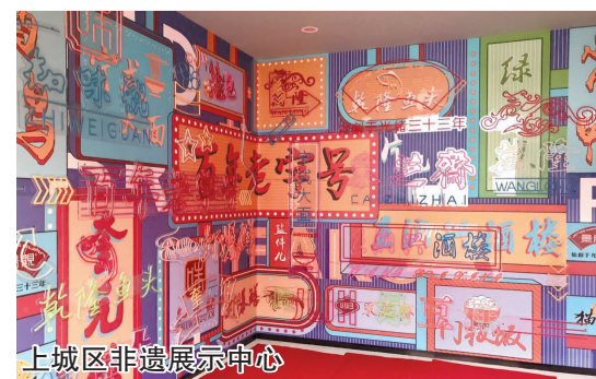
上城区非遗展示中心