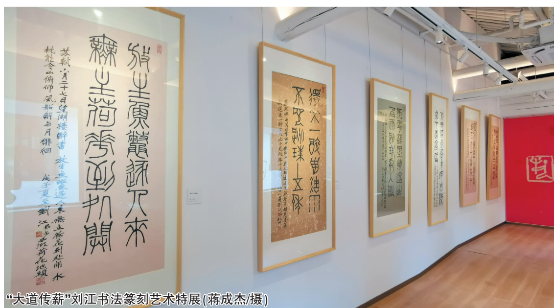
“大道传薪”刘江书法篆刻艺术特展(蒋成杰/摄)