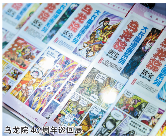
乌龙院40周年巡回展