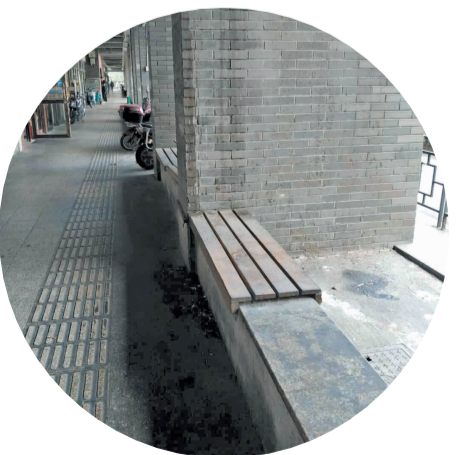
庆春路99号附近路边公共座椅缺失

公共座椅是人们日常生活中不可缺少的公共设施,同时也是城市公共环境的重要组成部分。日前,在庆春路99号附近,记者发现,有一处公共座椅