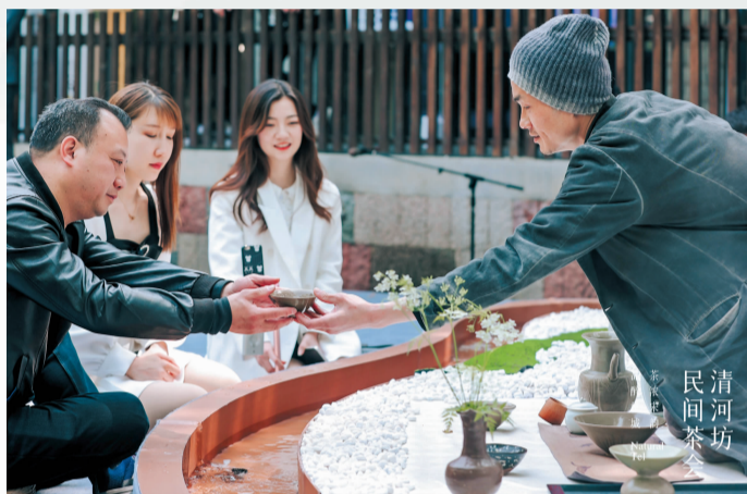
游客、市民在曲水流觞异形舞台抿尝好茶