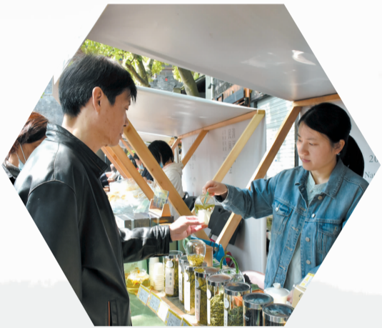
游客、市民在逛茶集、品茶味